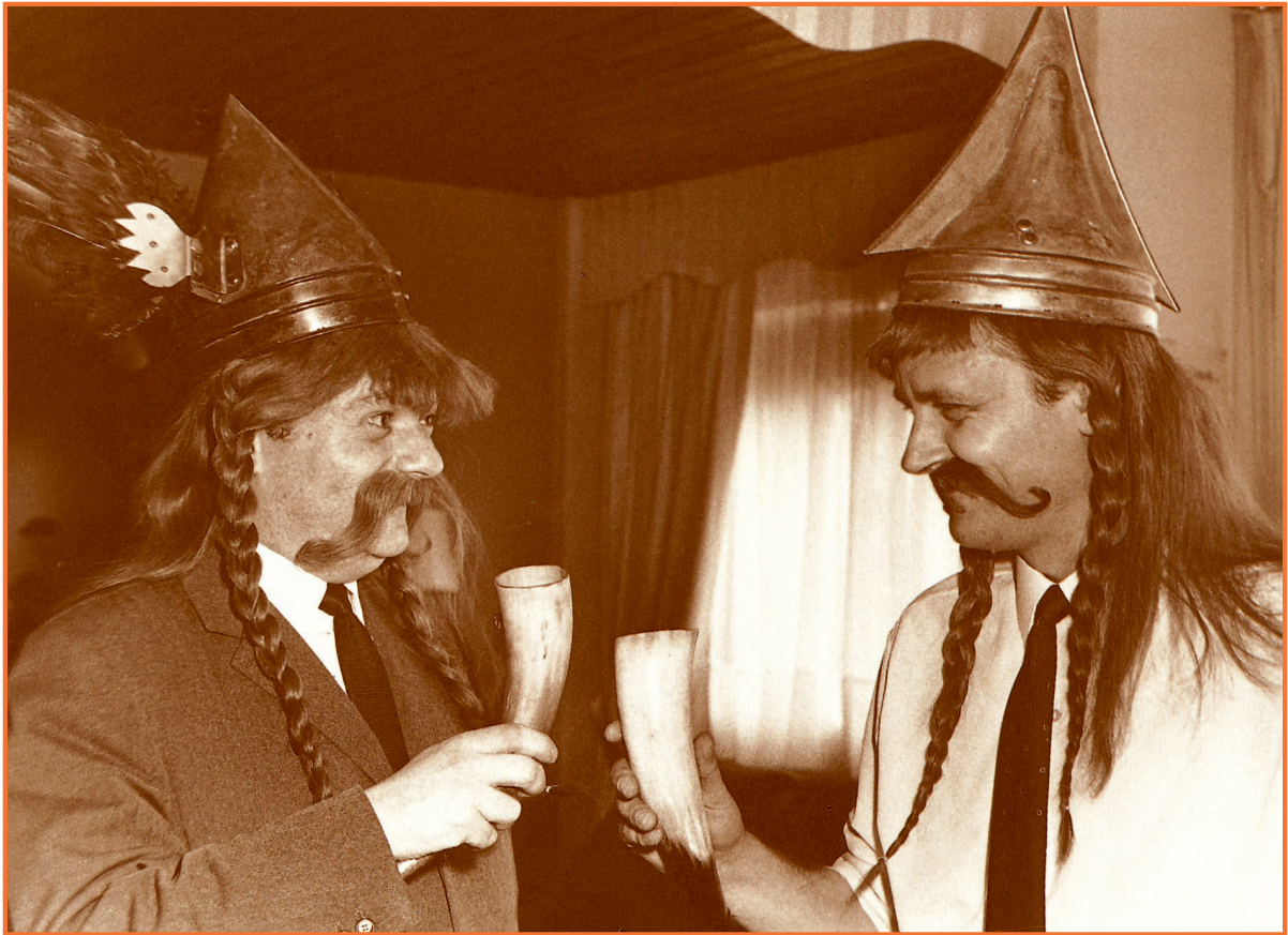
1966 – Autori nazdravljaju za Asteriksovu budućnost. (Foto PARI MAČ / Pišri)